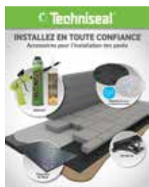
Accessoires d'installation de pavés