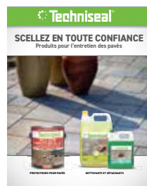
Produits pour l'entretien des pavés