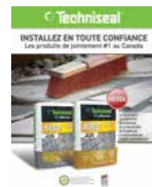
NOCO™ jointoiment polymérique

Contactez votre représentant Techniseal® local, visitez techniseal.com ou composez le 1 800 465 7325 pour plus de détails