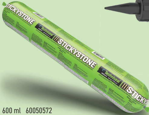
600 ml 60050572

ADHÉSIF À USAGE VERTICAL POUR AMÉNAGEMENTS EXTÉRIEURS